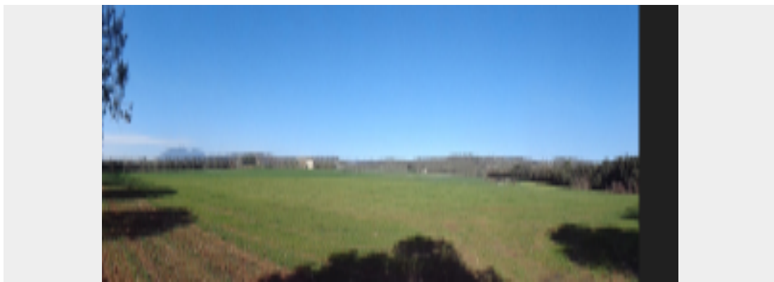
Zona on s'observa l'aufrany. Avinyonet de Puigventós.