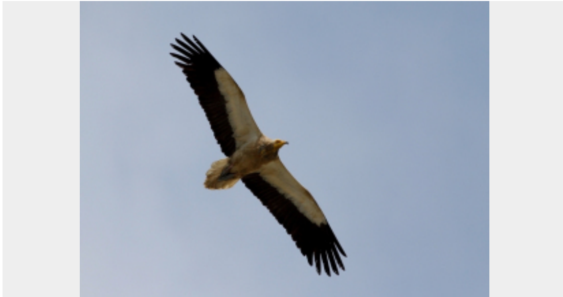
Neophron percnopterus. Adult.