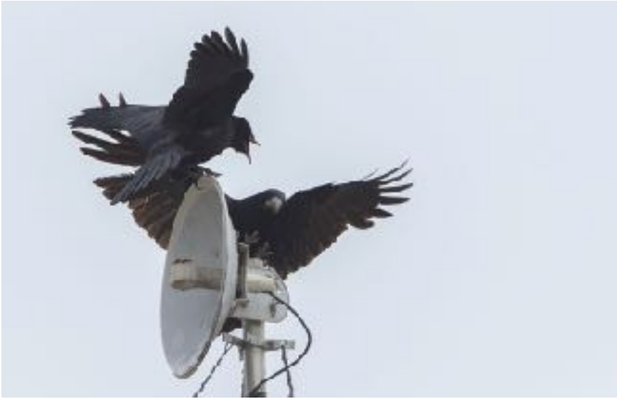
Un dels exemplars adults i el juvenil observats a Figueres el 25-05-2018.

En definitiva caldrà estar ben atents a les properes observacions d'aquesta espècie a l'Empordà, especialment en futures temporades de cria per poder confirmar amb total certesa la graula com a espècie reproductora a Catalunya