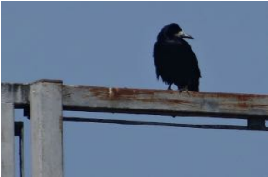
Un dels exemplars adults observats a Figueres el 24-05-2018.