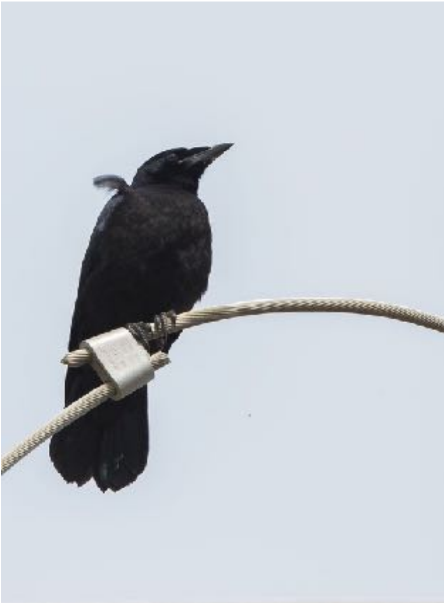
L'exemplar juvenil observat a Figueres el 25-05-2018.